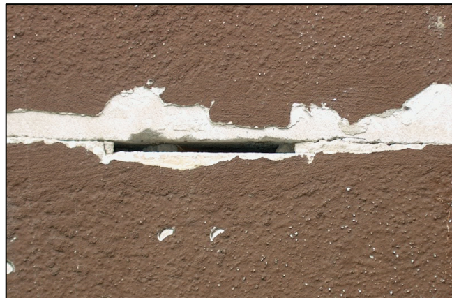
Trhlina v mieste škáry medzi prvkami vyplnená maltou pri kompletácii pórobetónových panelov (systémová porucha)

The dwelling house is located on a flat area of Bratislava – Raca. The house was built in 1988 in P 1.15 - structural system with overall walls from claps porous concrete elements in thickness 300 mm. The house is one sectional with 7 storeys. 6 storeys are for dwelling aim and 1 storey is technical-entrance. The house is orientated by longitudinal line to the south-west and the north-east side. The entrance is orientated on the south-east side. The communication way is made by two stairs and by two personal elevators. The main building entrance passes across the closing door space. The dwelling house has imbedded loggias.