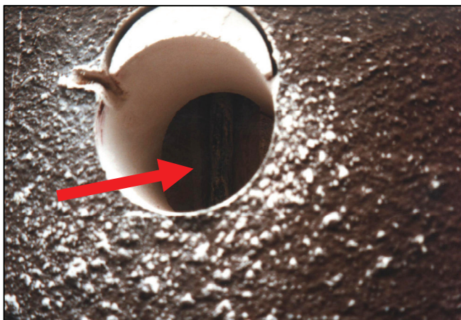
Pohľad na miesto sondy s chýbajúcou zálievkou spínacieho tiahla

View on the probe made in the place of switching rod with missing grout