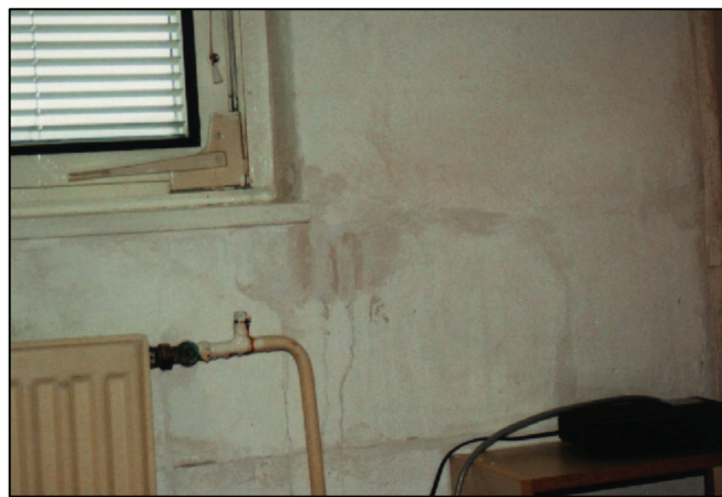
Trhliny a záteky na vnútornom povrchu pórobetónových spínaných dielcov

View on the probe made in the place of switching rod with missing grout