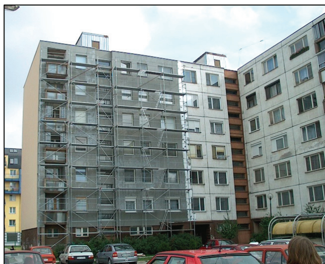
Žiadne priečelie v priebehu zatepfovania Back facade of the dwelling house during realization of the additional thermal protection

Panel obvodového plášťa sú vytvorené zopnutím vystužených dielcov. Pórobetónové prvky obvodového plášťa výšky 600 mm boli spájané a kompletizované v Bratislave. Vystužené dielce sa vyrábali z pórobetónu na báze piesku - plynobetónu - v závode Šaštín - Stráže. Vodorovné styky medzi dielcami sú vyplnené maltou. Spínacie ťahadlo umiestnené v otvore v strede hrúbky steny je zaliate maltou. Panely boli maximálne kompletizované už vo výrobnom závode (osadené otvorové výplne s oplechovaním, nanosené vonkajšie a vnútorné povrchové úpravy, atď.).