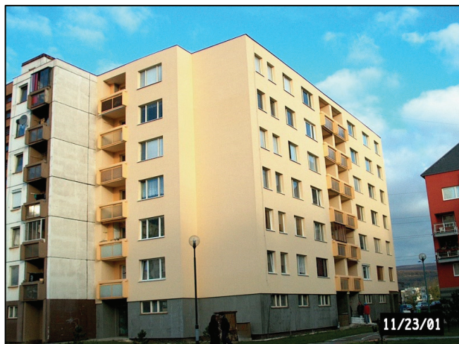
Celkový pohľad na obnovený bytový dom Pri Šajbách č. 30 v Bratislave – vstupné priečelie

Na zateplenie je najlepšie uplatniť kontaktný zateplovací systém. Hrúbka tepelnej izolácie z dosiek penového polystyrénu alebo minerálnovláknitých dosiek bola výpočtom určená z hľadiska úspory tepla a hygienického kritéria. Bola stanovená na 60 mm. Použili sa rozperné kotvy, ktoré majú deklarovanú únosnosť i pre pórobetón. Uplatnil sa kontaktný zateplovací systém Baumit.