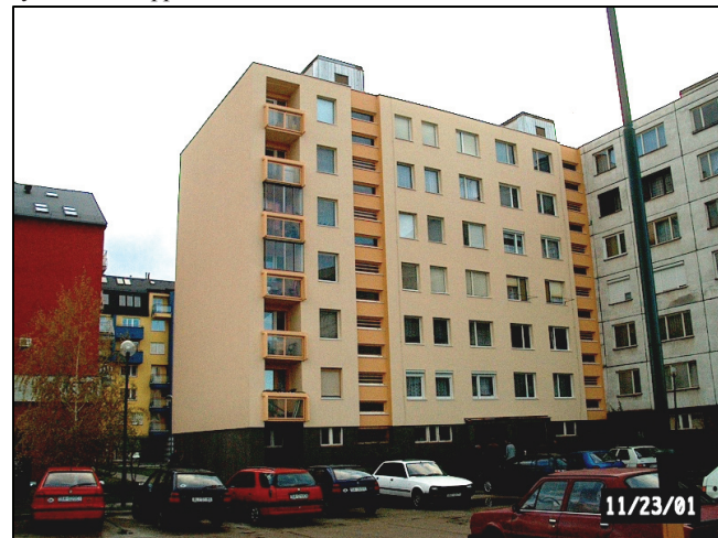
Celkový pohľad na obnovený bytový dom Pri Šajbách č. 30 v Bratislave – zadné priečelie

Contact thermo-protecting system is the most effective as the additional thermal protection. The thickness of thermal insulation was calculated complexly on the base of heating savings and hygienic criterions. The boards of foam polystyrene or mineral fibres boards in thickness 60 mm were designed for the additional thermal insulation. The dowels, which declared a carrying capacity either for porous concrete material, were used. Baumit - the contact thermo-protecting system were applied.