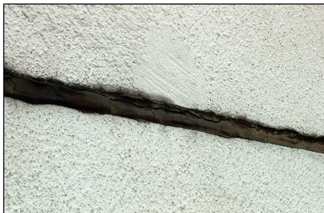
Pohľad na trhliny v tmeli uzavretých škár medzi pórobetónovými obvodovými dielcami

Budova sa nachádza v rovinatom území Bratislava - Rača. Postavená bola v roku 1988 v stavebnej sústave P 1.15 s obvodovým plášťom z pórobetónových spínaných dielcov hrúbky 300 mm. Jedná sa o bytový dom s jedným vstupom so 7 nadzemnými podlažiami. Z toho je 6 obytných podlaží a jedno podlažie technické - vstupné. Dom je orientovaný pozdĺžnou osou približne na juhozápad - severovýchod so vstupmi v priečeli juhovýchodnej orientácie. Komunikačné jadro tvoria dve schodiská, každé s osobným výťahom. Vstup do budovy je cez uzatvárateľné zádverie. Bytový dom má zapustené lodžie.